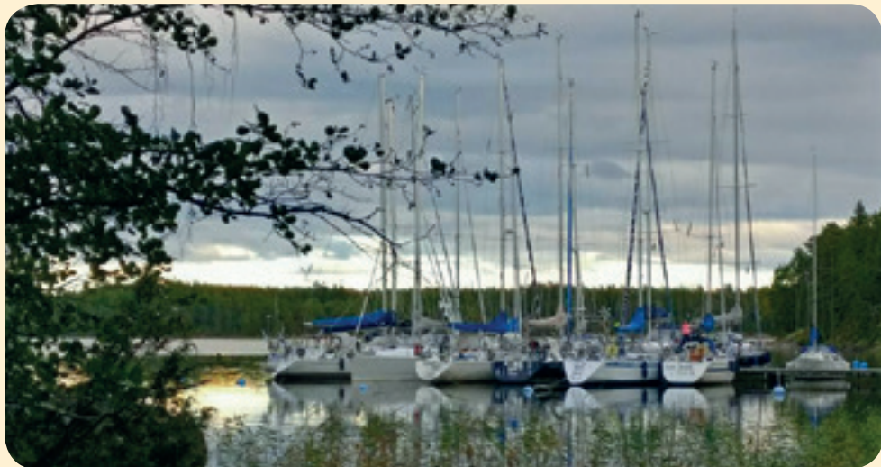
Rishamnin laiturisiis lähes täynnä.