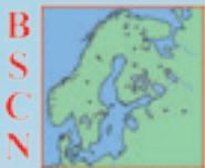
Baltic Sea Cruising Network

Ohjelmassa mm. majoitus ja illallinen Hotel Clarionissa, HSK:n esittely ja lounas Blue Peterissä, ekskursio vartiolaiva Turvaan tai jäänsärkijöille, Itämeri painotteinen vierailu John Nurminen Säätiöllä, illallinen Katajanokan Kasinolla, uinti, sauna ja lounas Allas Sea Poolissa. Syyskokouksessa esitetään kutsu ja ohjelma ICCY 2019 Helsinki kesätapaamisesta heinäkuussa, jolloin voimme sijoittaa venevieraat kootusti satamaamme.