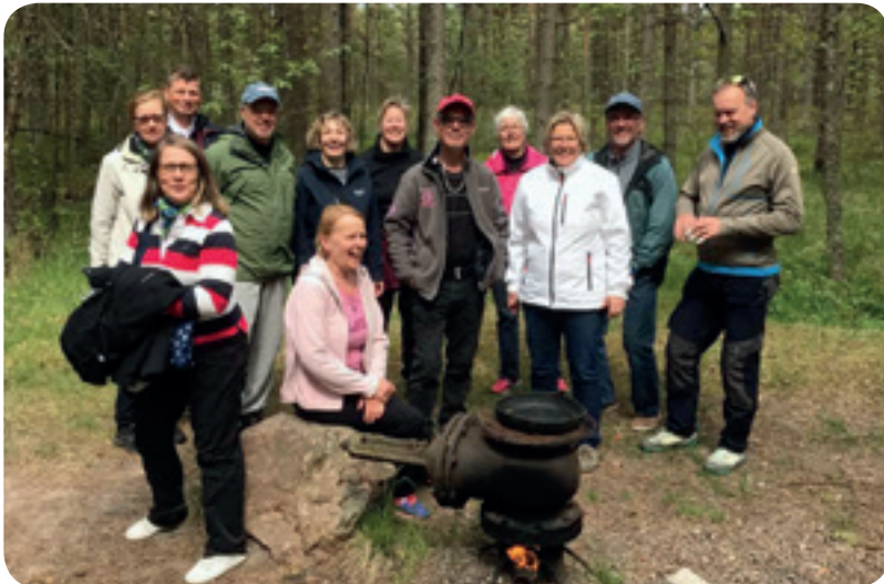
Eskaaderilaisia tutustumassa palavaan kaasuputkeen.