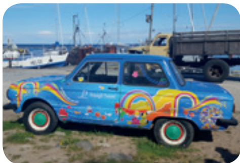
Pranglin satamassa on komeasti maalattu Lada.