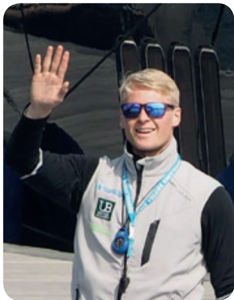
Ensimmäinen kansainvälisen kilpailun voitto.

Myös urheilullisten arvojen sisäistäminen on ottanut oman aikansa.