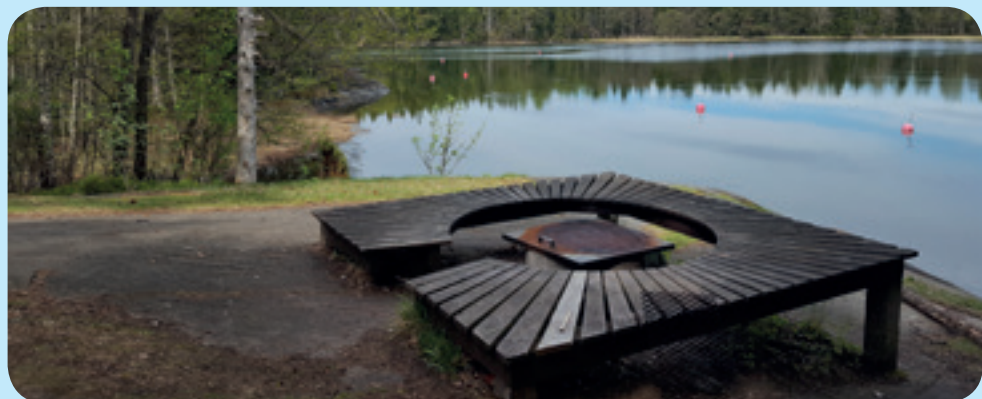
Bockhamn. Rauhallsuuden tyysijä.

grillikatos. Ennako-odotukset olivat korkealla johtuen monista kuulemistani kehuista, mutta parempaa oli luvas- sa kuin odotin. Ulko-Nuokosta tuli ehdoton paikka ensi viisiitillekin. Läntiset pehmeän näköiset kalliorannat sekä paikan yleinen tunnelma on parhaimmillaan rauhoittumiseen. Tunnin päikkärit aurinkoisilla kalliolla tekivät todella hyvää!