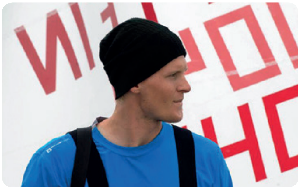
Kajiansinkon tutuksi tullut määrätietoinen katse.

opintoihin sekä valikoidummin valmentamiseen. Tällä uudella asetelmalla se on mahdollista. Vähemmän reissamista, iltaisin ja viikonloppuisin enemmän vapaita. Hoskilla tahti oli tiivistä niin kotimaassa kuin ulkomailla läpi kausien. Kyllähän me veimmekin uskomattoman määrän uusia projekteja maaliin viimeisen viiden kauden aikana.