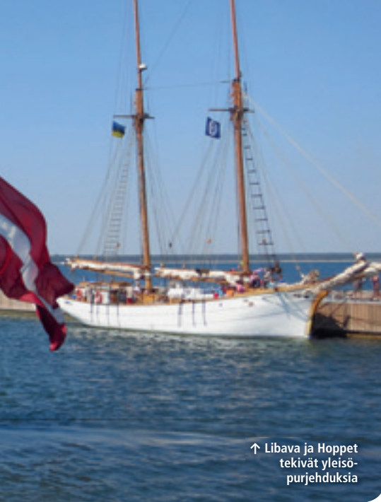
↑ Libava ja Hoppet tekivät yleisöpurjehduksia