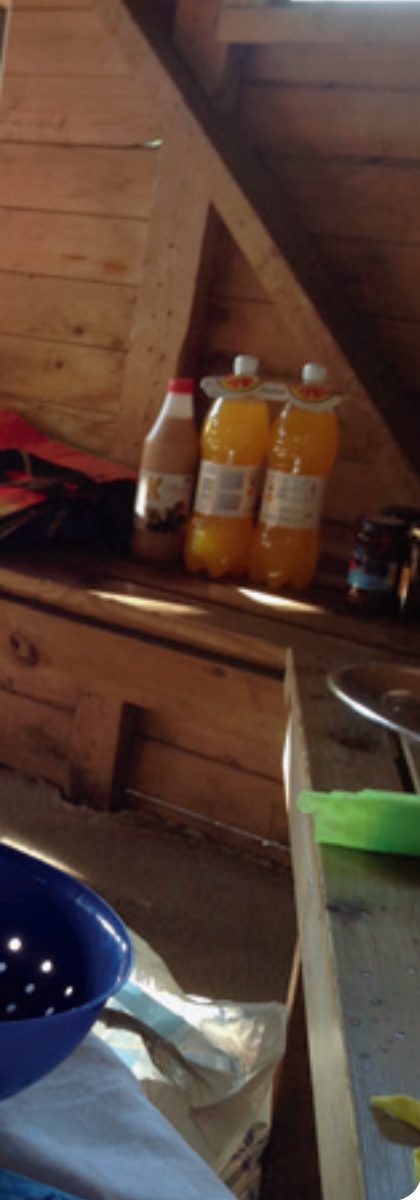
↑ ↗ Runsas tarjoilu käy kaupaksi.