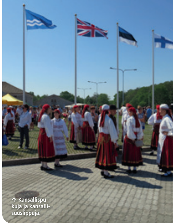
↑ Kansallispuukuja ja kansallispuuslippuja.

torakennus. Syksyllä avattavaan 2800 neliön lämpimään talvisäilytys-, korjaus- ja huoltokeskukseen on jo paljon tilauksia. Jo nyt sataman erikoisuutena on useita siestejä kukkapenkkejä, joiden hyötykasveina on viisi erilaista mausteyrttiä; minttu, oregano, rosmariini, ruohosipuli ja timjami. Näitä saa vapaasti käydä napsimassa venevierailun aikana ja niinpä raikkaan vileät Mojito-drinksut tuureutettiin mintunlehdillä. Ensi kesäksi on suunnitteilla myös jääpalakone. Iltatunnelmaa luovat myös sataman alhaalta valaistut lipputangot (joka loistava idea saatiin tuliaisena omaan kotisatamaan).