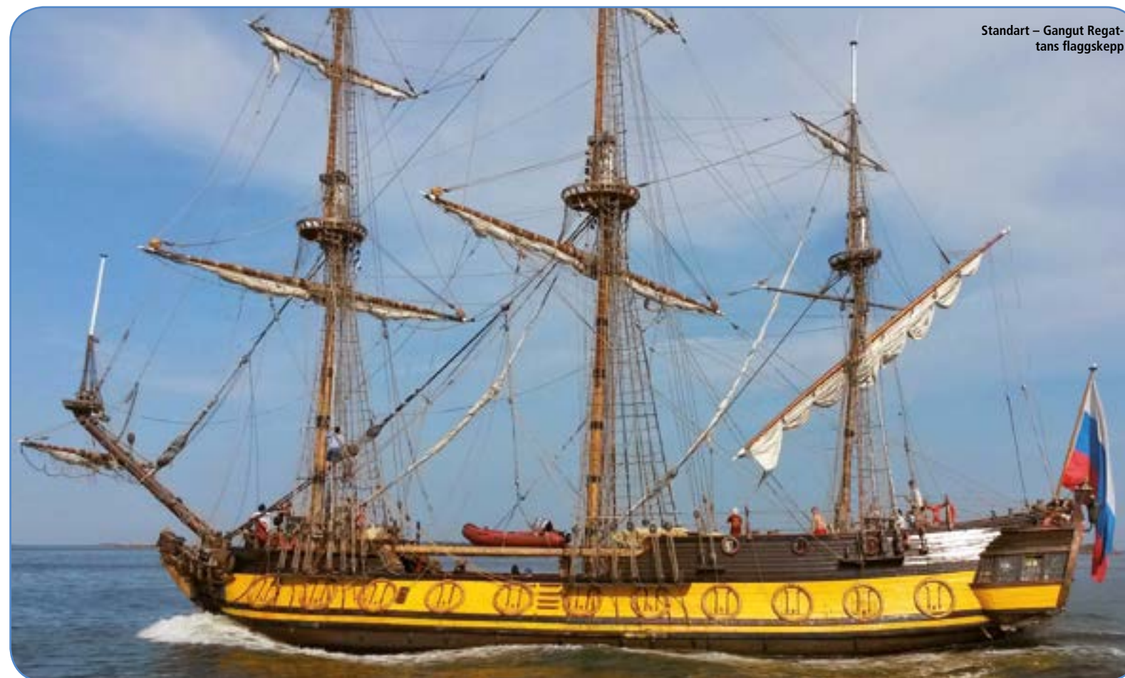
Standart – Gangut Regattans flaggskepp

Ett av evenemangen var segelparaden till Rilax från Hangö som som leddes av det ryska flaggskeppet Shtandart i vackert och så varmt (30 C)väder, att två man i hedersvakten svimmade under den långa ceremonin vid monumentet i Rilax. Vår försvarsminister som inte behövde stå i givakt tycks ha klarat sig bättre.