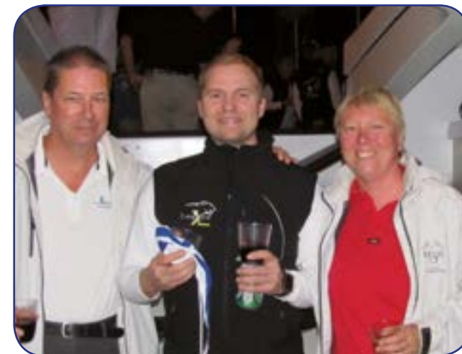
Viralliset valvojat, Vesalaiset.