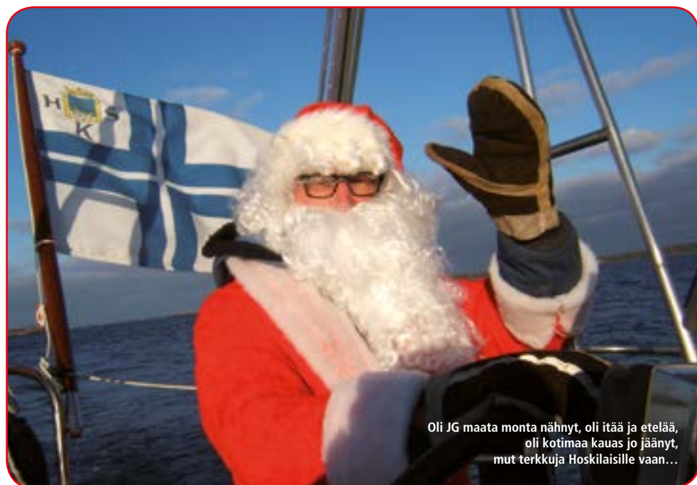
Oli JG maata monta nähnyt, oli itää ja etelää, oli kotimaa kauas jo jäänyt, mut terkkuja Hoskilaisille vaan...

taava. Tiskit; Hei-Kosti, edellyttäen, että Kosti sai taklattua Äppön pois pentristä, ja sit jotain juotavaa.